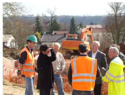
Réunion de chantier

Réhabilitation du centre du village (rues E. Gérard, Paturaud, P. Gantois, place Leredde, rue Cdt Fiatte, carrefours de la mairie et de l'église).