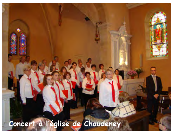
Concert à l'église de Chaudeney

Mise à disposition de la salle M. Bouchot pour les dons du sang.