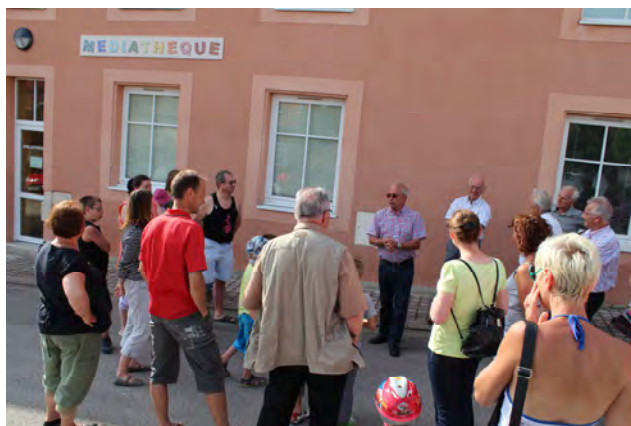
Inauguration de la mosaïque de la médiathèque

Cela fait partie de nos très grands motifs de satisfaction.