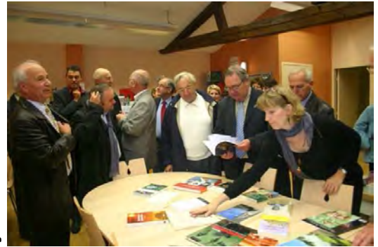
Inauguration de la médiathèque

Réalisation de l'extension de la salle M. Bouchot pour l'accueil des élèves pour le repas de midi.