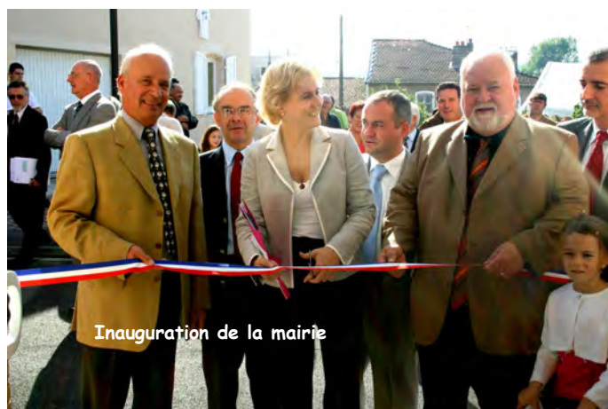
Inauguration de la mairie

Réhabilitation de la mairie. En réalité seuls les murs ont été conservés.