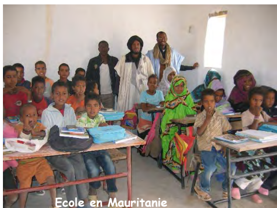
Ecole en Mauritanie

Elle s'exerce tout naturellement et comme dans toutes les communes par le canal du CCAS.